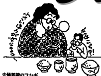
夫婦茶室のフジイ イラスト：Open Season!